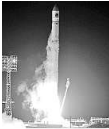
Décollage de la fusée transportant la sonde Phobos-Grunt .

Un Saoudien accusé d'être le cerveau des attentats contre le navire américain USS Cole et le pétrolier français MV Limburg a été formellement mis en accusation à Guantánamo. Il s'agit du premier détenu renvoyé devant la justice militaire d'exception sous Barack Obama. Le procès débutera au plus tôt en novembre 2012, mais pourrait être retardé. —AFP